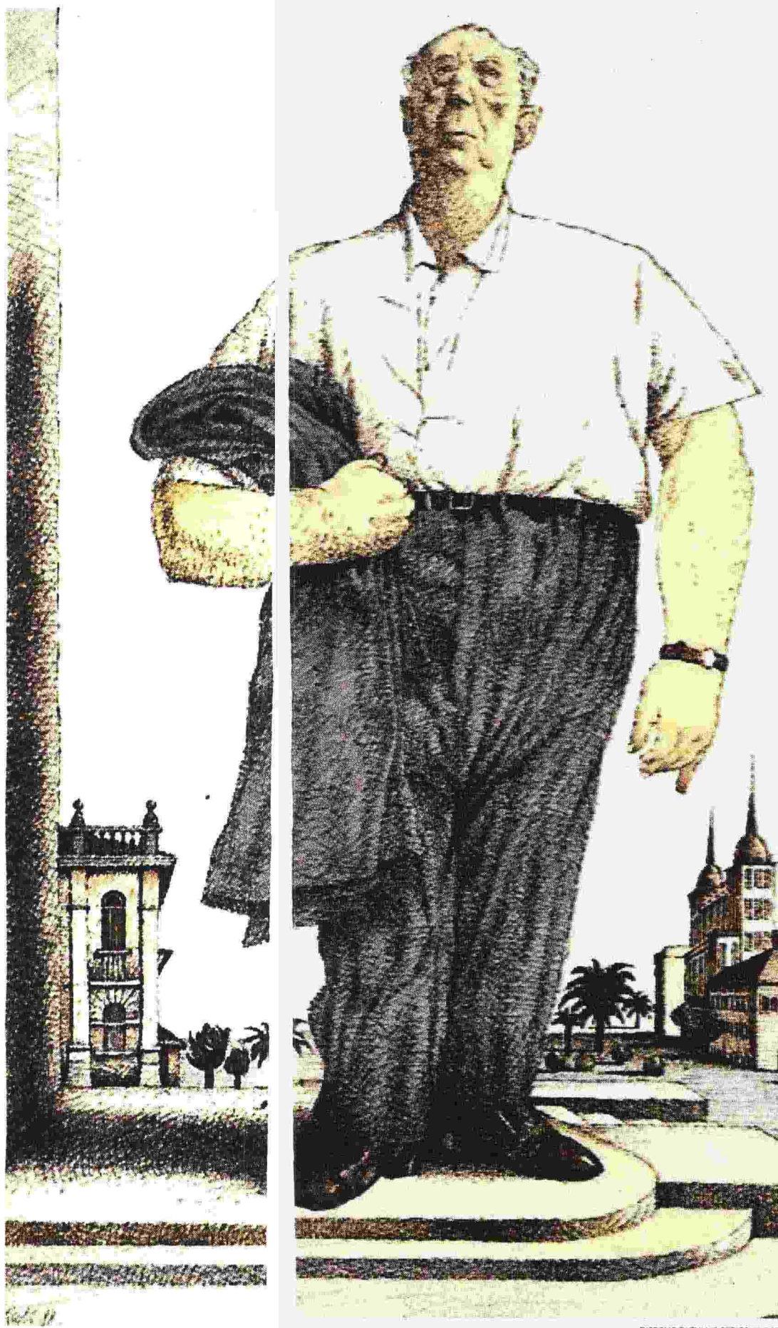
DISEGNO DI TULLIO PERICOLI/1988

Ritaglio stampa ad uso esclusivo del destinatario, non riproducibile.